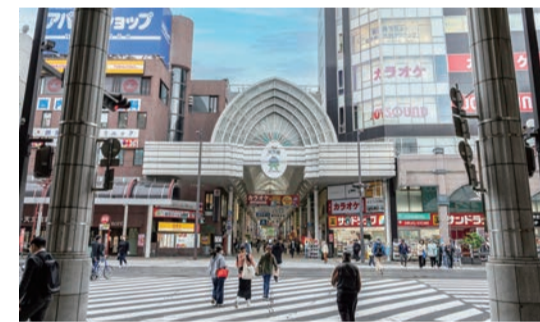
天文館アーケード 徒歩約9分(約700m)

2面接道によって隣接する建物との一定の空間を確保し、日当たりや眺望を確保しています。