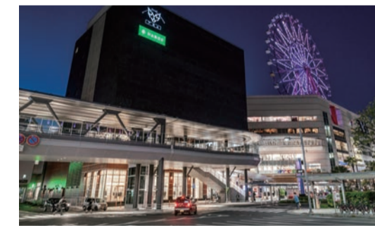
JR鹿児島中央駅 / アミュプラザ鹿児島 徒歩約9分(約720m)

鹿児島中央駅から徒歩圏内。商業、交通、教育と、豊かな暮らしに必要なものを生活圏内に有した上之園アドレス。どんな生き方も叶えてくれる「自由度」の高い場所、「上之園自由区」。あらゆる暮らしにフィットする、新しい住まいが誕生します。