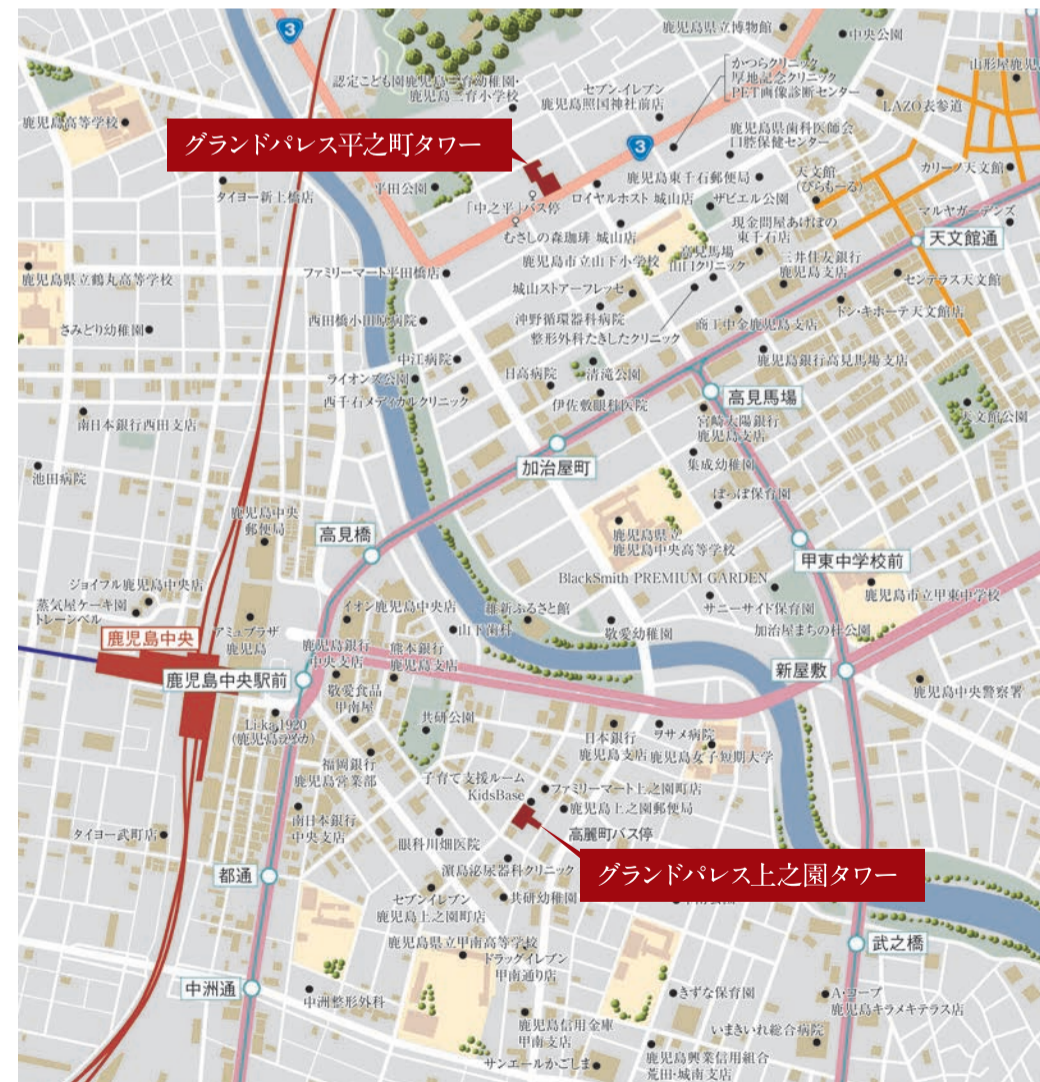
平田公園 徒歩約3分(約210m)