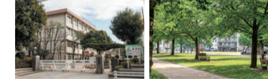
鹿児島市立中洲小学校 徒歩約8分(約620m)