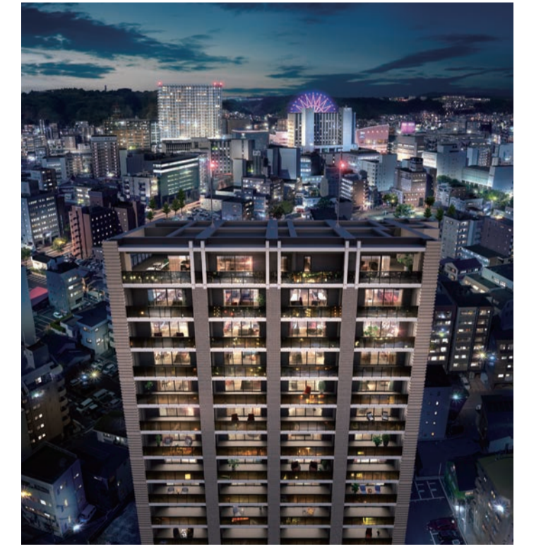
※掲載のCGパースは、現地周辺にて撮影したものに一部CG加工を施しており実際とは異なります。(2024年2月の調査時点)

【物件概要】●名称/グランドパレス平之町タワー●所在地/鹿児島市平之町12番19(地番)●交通/南国交通「中之平」バス停 徒歩1分●用途地域/商業地域・第2種住居地域●建ぺい率/70.73%●容積率/307.32%●敷地面積/1,833.13㎡●構造・規模/鉄筋コンクリート造 地上20階地下1階建●建築面積/602.90㎡●延床面積/6,977.72㎡●総戸数/73戸●販売戸数/未定●間取り/2LDK・2LDK+S・3LDK・4LDK●専有面積/57.75㎡~105.75㎡●バルコニー面積/10.45㎡~19.90㎡●サービスバルコニー面積/3.75㎡(Dタイプ・Gタイプ)●ルーフバルコニー面積/19.90㎡(Ftype)●38.25㎡(Etype)●販売価格/未定●最多販売価格帯/未定●管理費(月額)/未定●修繕積立金(月額)/未定●修繕積立金(一括)/未定●駐車場/81台(分譲駐車場13区画15台・縦列駐車場4区画8台含む)●駐車場使用料(月額)/未定●分譲駐車場販売価格(1区画)/900万円●分譲駐車場管理費(月額)/500円●分譲駐車場修繕積立金(月額)/500円●バイク置場/5台●バイク置場使用料(月額)/2,000円●自転車置場/72台●自転車置場使用料(月額)/200円~300円●建築確認番号/第ER1-24002761号(2024年3月28日)●工事完成予定年月/2027年3月●引渡し予定年月/2027年3月●先主・事業主/第一交通産業株式会社●設計・監理/株式会社久保建築設計●施工/株式会社イテケン●管理形態/区分所有権全員により管理組合を結成し、管理会社に委託●分譲後の権利形態/敷地・建物(共用部分)/建物専有面積及び分譲駐車場専有面積を基準とする共有●建物(専有部分)/区分所有権 【第一期一次物件概要】●販売戸数/3戸●間取り/2LDK・3LDK●専有面積/61.95㎡~82.95㎡●バルコニー面積/11.80㎡~13.70㎡●サービスバルコニー面積/2.40㎡(Dtype)●販売価格/3,680万円~7,140万円●管理費(月額)/7,400円~10,000円●修繕積立金(月額)/7,400円~10,000円●修繕積立金(一括)/310,000円~415,000円 【第一期三次物件概要】●販売戸数/5戸●間取り/2LDK・3LDK●専有面積/61.95㎡~82.95㎡●バルコニー面積/11.80㎡~13.70㎡●サービスバルコニー面積/2.40㎡(Dtype)●販売価格/3,980万円~7,090万円●管理費(月額)/7,400円~10,000円●修繕積立金(月額)/7,400円~10,000円●修繕積立金(一括)/310,000円~415,000円●取引条件の有効期限/2025年4月末日【九公取】087