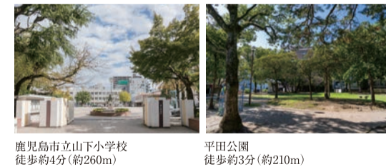
鹿児島市立山下小学校 徒歩約4分(約260m)